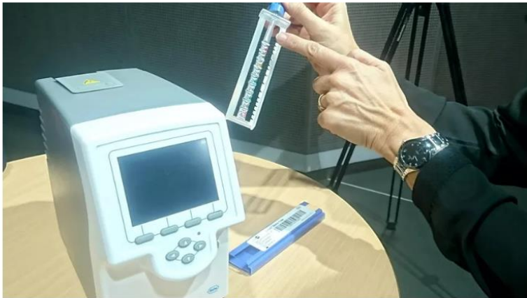
Le Cobas Liat, un laboratoire miniature pour diagnostiquer la grippe en 20 minutes

A partir de cet hiver, des laboratoires miniatures seront installés à l'entrée des urgences de l'hôpital de Grenoble (Isère), pour permettre aux infirmières de l'accueil de vérifier si les patients qui se présentent avec de la fièvre et de la toux ont la grippe. Et en vingt minutes seulement !